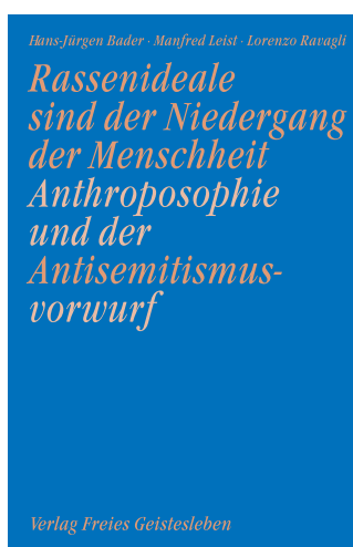
Hans-Jürgen Bader/Manfred Leist/Lorenzo Ravagli: Rassendideale sind der Niedergang der Menschheit. Anthroposophie und der Antisemitismusvorwurf.

Zu beziehen bei: Bund der Freien Waldorfschulen, Wagenburgstr. 6, 70184 Stuttgart, bund@waldorfschule.de